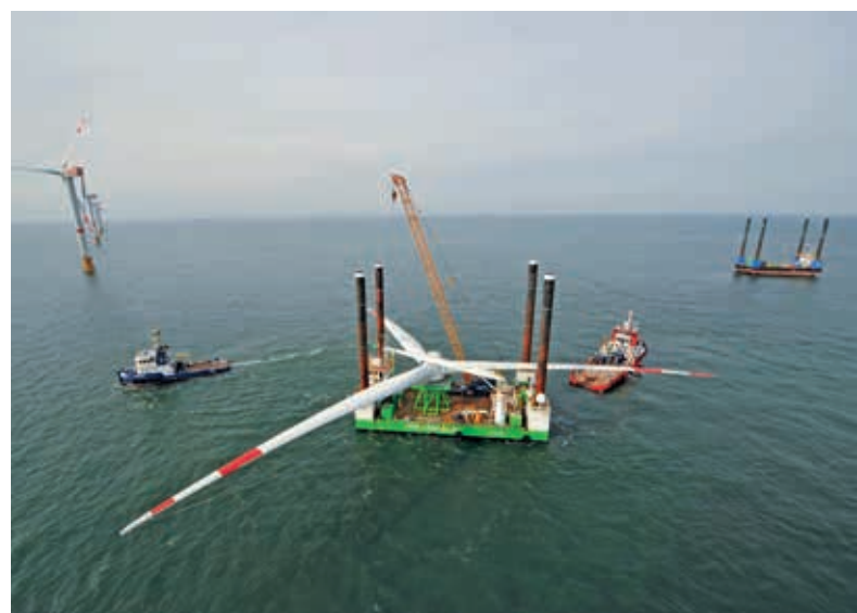
Ein Jack-Up Barge transportiert einen gigantischen Rotorstern komplett auf die Offshore-Baustelle. Schlepper sind dabei unverzichtbare Helfer.