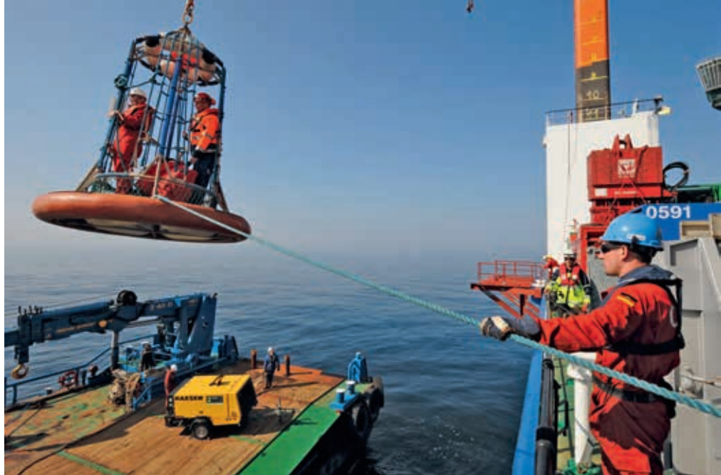
Das Übersetzen im Personenkorb erfordert Erfahrung und die richtige PSA (Persönliche Schutzausrüstung gegen Ertrinken und Absturz). Und nur selten ist die See so ruhig wie auf diesem Bild.

Auch für Baustellen an Land gilt, dass bei starkem Wind nicht montiert werden kann. Aber auf See gibt es häufiger stärkere Winde und Wellen. So spielt die Überwachung des Wetters auf den Hochseebaustellen eine große Rolle. Die eigenen meteorologischen Kenntnisse der Nautiker sind gefragt wie selten in der modernen Seefahrt.