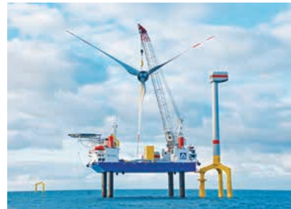
Stetig werden neue Fahrzeuge eingesetzt, hier das Hubschiff „Thor“ der Hochtief Solutions AG.

Die Intensität dieser praktischen Übung ist beeindruckend. Auch hier steht die Sicherheit der beteiligten Menschen an ers-