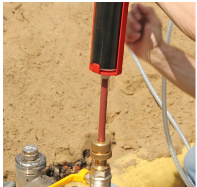
Abbildung 4: Einbringen des 2K-Absperrschaums mittels pneumatisch angetriebener Schaumpresse

Die Grundidee des innovativen und durch die Stadtwerke Karlsruhe patentierten Verfahrens illustriert Abbildung 1. Es beruht auf der Einbringung eines eigens entwickelten 2K-Absperrschaums in die Anschlussleitung, um die Gaszufuhr zur Arbeitsstelle sicher und einfach zu unterbrechen. Durch eine mobile Schleuse hindurch wird die Anschlussleitung angebohrt und der Schaum eingebracht. Der Absperrschaum sitzt nach kurzer Aushärtung als gasdichter Pfropfen in der Anschlussleitung und trennt diese vom