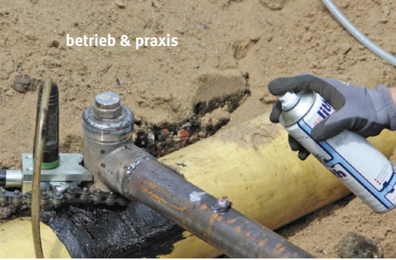
Abbildung 5: Kontrollprüfung auf Schaumdichtigkeit nach Demontage des Kugelhahns

DN 65 eingesetzt und überzeugt durch die einfache und sichere Handhabung. Dabei immer im Fokus: die Sicherheit der Mitarbeiter beim Abtrennen einer Gasleitung. Bei der nächsten Aktualisierung der DGUV-Regel 100-500 ist eine explizite Nennung des neuen Verfahrens als ein Arbeitsverfahren mit geringer Gefährdung fest vorgesehen.