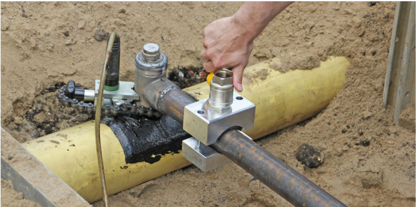
Abbildung 2: Montage des Kugelhahns