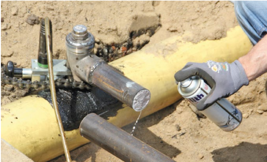
Abbildung 6: Kontrollprüfung auf Schaumdichtigkeit nach Trennung der Stahlleitung direkt vor dem Bohrloch