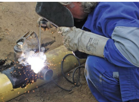
Abbildung 7: Verschweißen des Endkapen-Überschiebers

Die berufsgenossenschaftliche Regel DGUV 100-500 (ehem. BGR 500), Kapitel 2.31 „Arbeiten an Gasleitungen“ beschreibt viele Arbeitsverfahren mit geringer Gefährdung für Arbeiten an Versorgungs- und Hausanschlussleitungen.