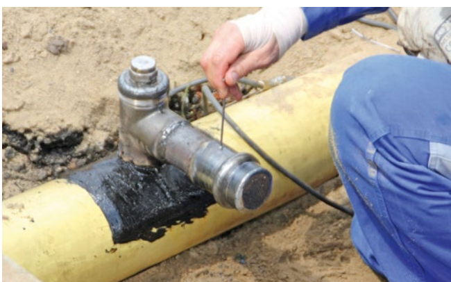
Abbildung 9: Stiftschraube einschrauben und verschweißen