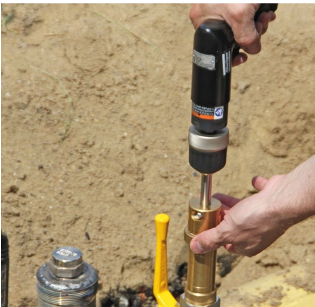
Abbildung 3: Anbohren der Gasnetzanschlussleitung mittels pneumatisch angetriebener Bohrmaschine