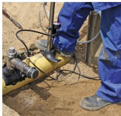
Abbildung 8: Prüfen der Schweißnaht mittels Druckluftpumpe