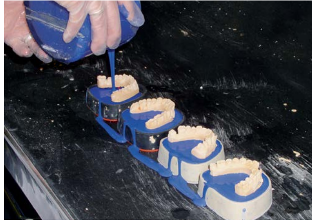
Ausgießen von Sockeln für Sägeschnittmodelle

Eine detaillierte Anfahrtsbeschreibung finden Sie im Internet unter www.bgetem.de → Presse/Aktuelles → Termine/Veranstaltungen → Informationsveranstaltung „Arbeitsschutz in der Dentaltechnik“, 1. und 2. April 2014 oder Webcode 12568821, Veranstaltungen 2014