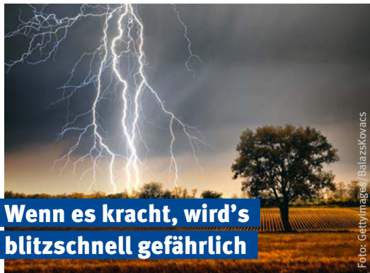
Wenn es kracht, wird's blitzschnell gefährlich