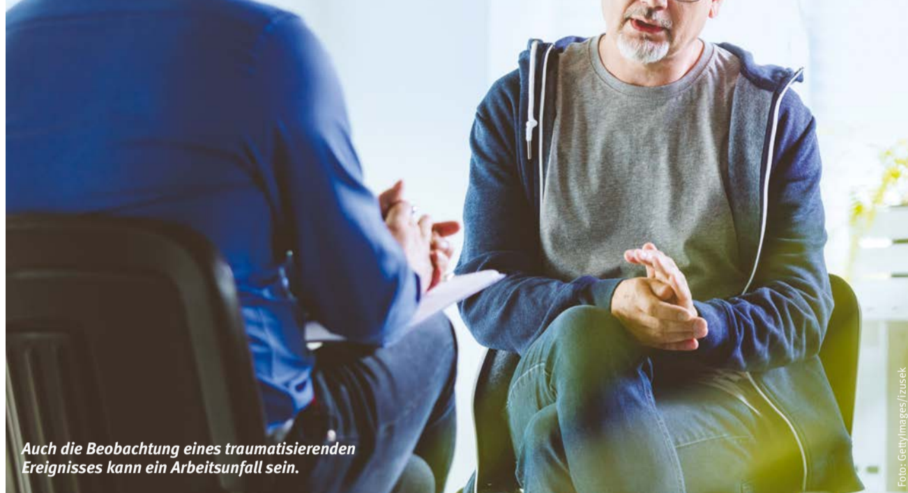
Auch die Beobachtung eines traumatisierenden Ereignisses kann ein Arbeitsunfall sein.

Wenn Augenzeuginnen oder Augenzeugen längerfristig psychische Pro-